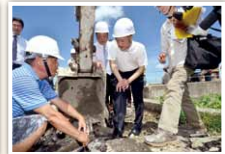
104 年彰縣大城自行車道刨除重作： 工程查核勘驗 1