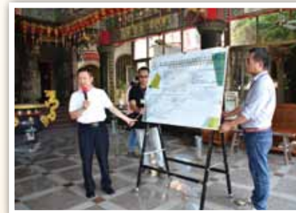
104 年彰縣大城自行車道刨除重作： 行前說明

的視察與抽驗人員，在發現「彰化縣大城鄉串連西南角生態區自行車道建置工程 13K+817 處」，有鋪設不平均、厚度不足等施工品質不良之嚴重缺失後，即立刻要求採取工程品質缺失矯正及預防措施。