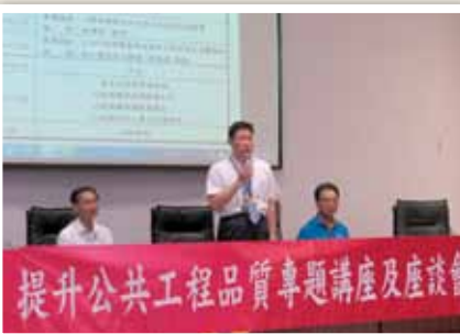
104 年彰化縣政府提升公共工程品質 專題講座暨座談會開幕致詞

為此，魏明谷縣長不但決議對缺失路段減價驗收，亦親自督導剷除重作作業，責成政風系統與工程單位做進度追蹤；另外，魏明谷縣長亦要求工程主辦單位落實三級品管制度及工程督導執行，並向施工廠商表達縣府對工程品質的水準要求與決心；同時，亦呼籲全民共同監督，藉由加強品管的方式，一方面提升道路工程品質與保障用路人安全，一方面則回應縣民對公共工程品質之要求與期待。