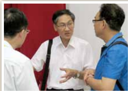
104 年彰化縣政府提升公共工程品質 專題講座暨座談會與會來賓會前討論