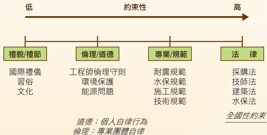
..... 工程倫理行為約束性示意圖（工程倫理手冊）

「倫理」是一套價值規範系統，「一般倫理」所論者為適用社會所有成員的價值規範，而「專業倫理」則是針對某一專業領域中的人員所訂出之相關規範，如工程倫理其行為約束性。首要意義在於建立專業工程人員應有的認知與實踐原則，及工程人員之間或與團體、社會其他成員互動時，應遵循的行為規範；而其探討的內容，說明工程人員應維護及增進其專業之正直、榮譽及尊嚴，增進工程人員對職業道德認識，使其個人以自由、自覺的方式遵守工程專業的行為規範，並利用所學之專業知識及素養提供服務，積極地結合群體的智慧與能力，善盡社會責任，達成增進社會福祉的目的。