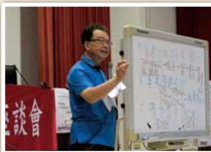
104 年彰化縣政府提升公共工程品質 專題講座—湯輝雄教授：公務員辦理公共 工程之角色定位及職責