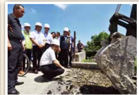
104 年彰縣大城自行車道刨除重作： 工程查核勘驗 2