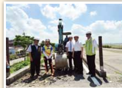
104 年彰縣大城自行車道刨除重作： 縣長與縣府人員會勘合影